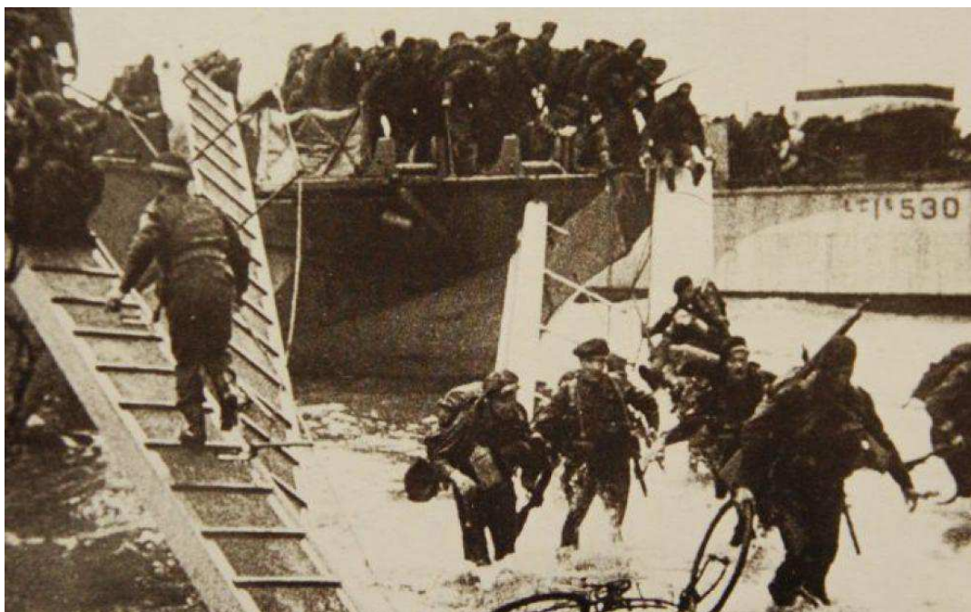
Des hommes du commando Kieffer débarquent en Normandie, le 6 juin 1944.

Le 19 janvier 2019, Ouistreham est devenue la ville marraine de cette unité de commandos. À l'occasion de l'anniversaire des 75 ans du débarquement, qui sera commémoré le 6 juin prochain sur ses plages, une statue du commandant Philippe Kieffer sera inaugurée en présence de sa famille. Un hommage au « père » des commandos et aux 177 Français débarqués sur les côtes normandes au matin du Jour J .