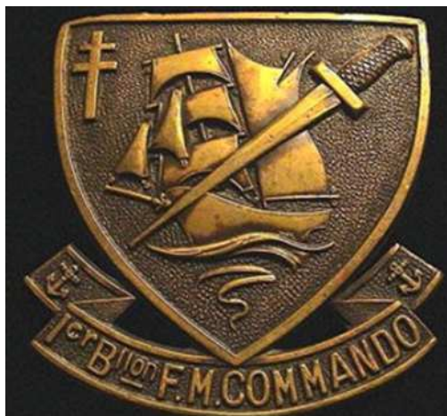
L'insigne du 1 er BFMC. Avec la croix de Lorraine en haut à gauche, il réunit le brick de l'aventure et le poignard des commandos.